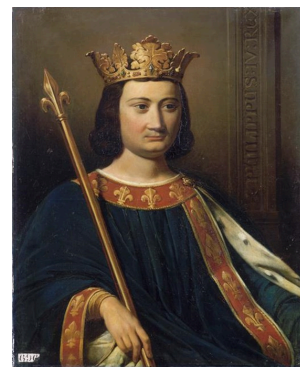
Filip IV Piękny

Ludwik IX, który panował w latach 1226–1270, znany jest ze swojego pobożnego życia i znaczących reform w administracji królewskiej. Jego rządy przyniosły stabilizację wewnętrzną i wzrost autorytetu monarszego, czego wyrazem było między innymi przeprowadzenie reform prawnych, które umocniły centralną władzę kosztem lokalnych baronów. Ludwik IX także brał udział w krucjatach, co umocniło jego pozycję jako lidera chrześcijańskiej Europy.